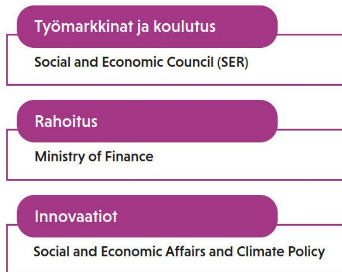
Kuva 2. Sektoreita poikkileikkaavat toimeenpanokomiteat sekä niistä vastaavat neuvostot tai ministeriöt